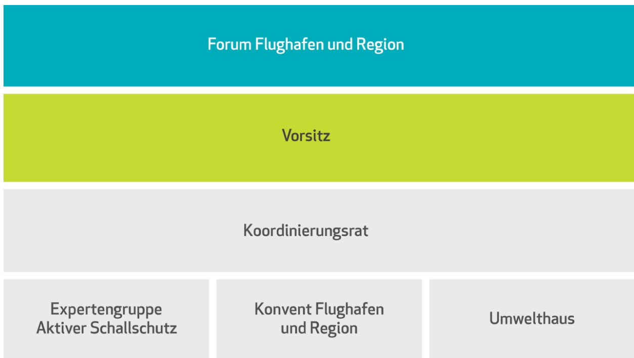
Strukturschema des FFR

Das Forum Flughafen und Region besteht aus fünf Gremien. Den Vorsitz im FFR hat ein dreiköpfiger Vorstand. Grundlage für die Arbeit aller Gremien ist die Geschäftsordnung des FFR.