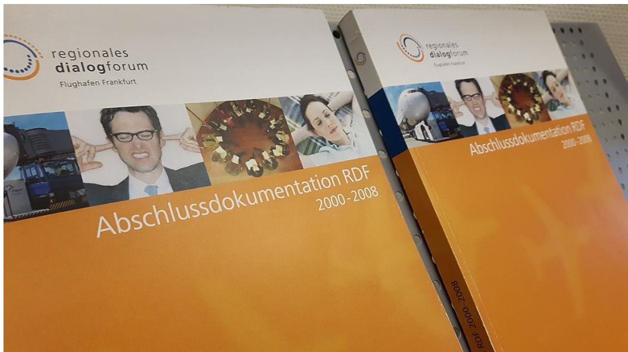
Abschlussdokumentation des RDF